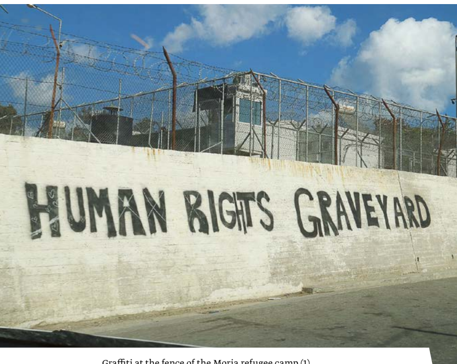
Graffiti at the fence of the Moria refugee camp (1) Grafitti am Zaun des Flüchtlingslagers Moria (1)

before COVID-19, their working and living conditions were bad and their wages low. Now, their permitted mobility—against all the rules that otherwise apply during the pandemic—and insufficiently implemented hygiene rules led to considerable additional health risks for them.