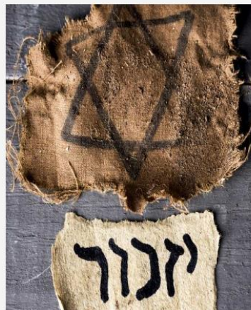
Antisemitismus als (pseudo-)religiöses Phänomen

Exkurs: Antisemitismus ohne Juden, gruppenbezogene Menschenfeindlichkeit