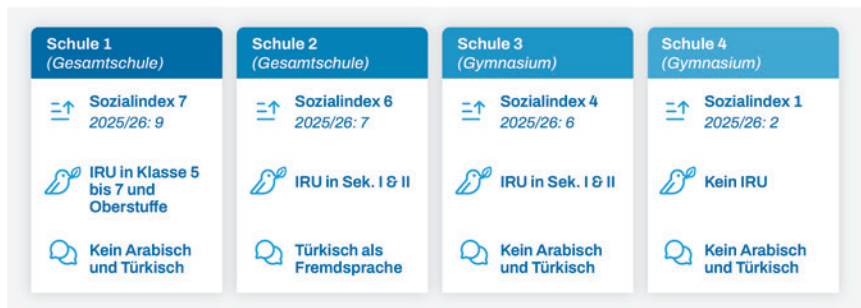
ABBILDUNG 1: SAMPLE

dem Prinzip des theoretical sampling (Glaser & Strauss, 1970), bei dem es nicht um eine Repräsentation einer Grundgesamtheit geht. Stattdessen wird die Auswahl danach getroffen, ob auf der Grundlage der theoretischen Vorüberlegungen, der Fragestellung und des für die Typenbildung wichtigen Kontrastkriteriums die jeweilige Schule eine