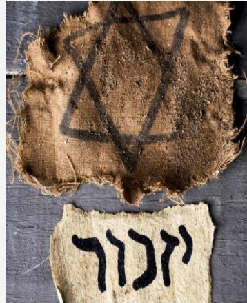
Antisemitismus als (pseudo-)religiöses Phänomen

Exkurs: Antisemitismus ohne Juden, gruppenbezogene Menschenfeindlichkeit