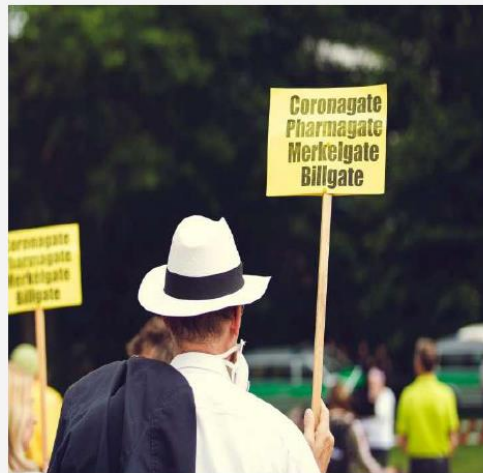
Exkurs: Länderkontexte und Verschwörungstheorien, vgl. Schlipphak et al. 2020

→ Juden jeweils als angebliche Urheber und Profiteure der (realen oder gefakten) Krise